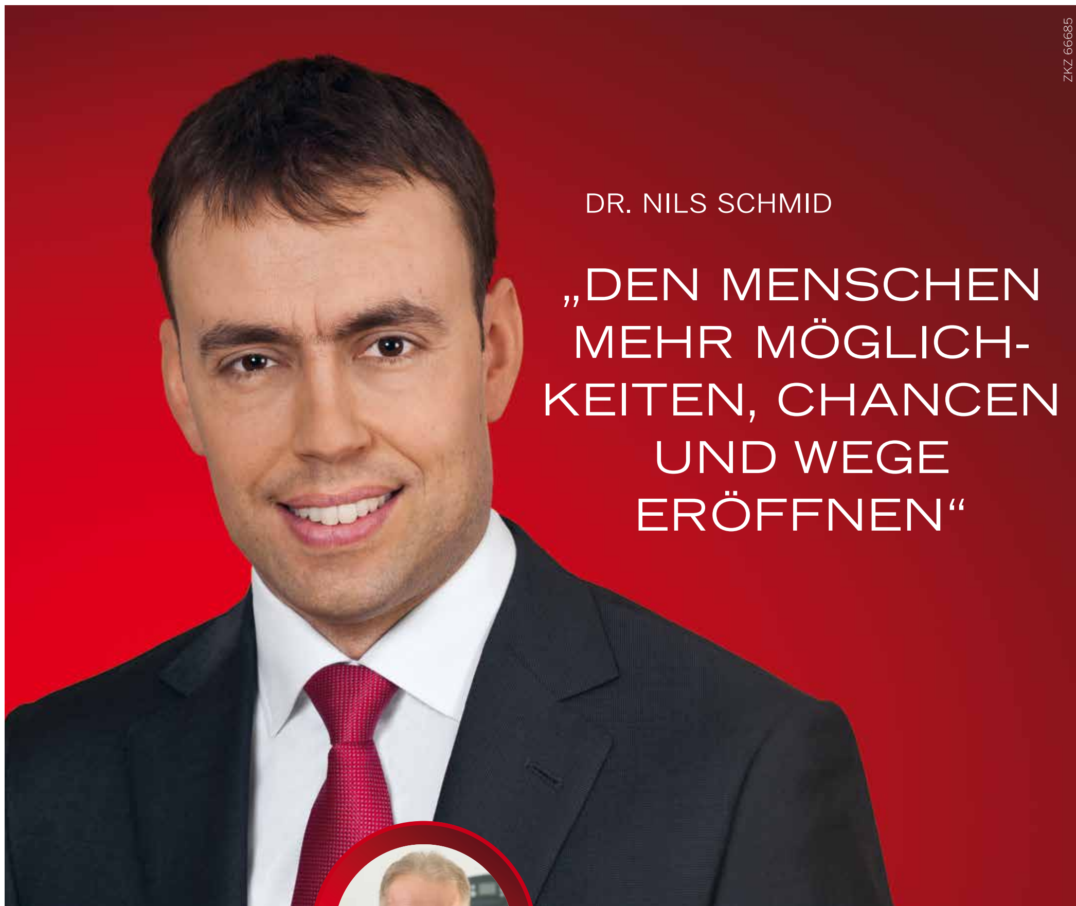
DR. NILS SCHMID

„DEN MENSCHEN MEHR MÖGLICHKEITEN, CHANCEN UND WEGE ERÖFFNEN“